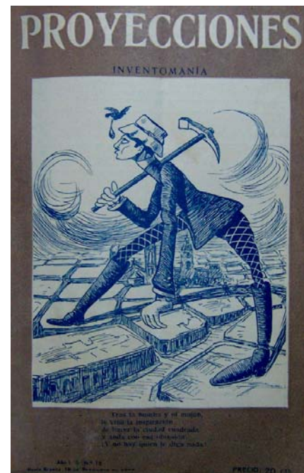
"Inventomanía", Proyecciones , Bahía Blanca, año I, n° 12, 18 de septiembre de 1909, portada.

La Nueva Provincia se refirió más seria y detalladamente a los proyectos de Almonacid. Al parecer, el agrimensor municipal habiéndose presentado ante los ediles de Bahía Blanca aseguró haber hallado los mojones originales de delineación de la Avenida Alem emplazados por el Ingeniero Pedro Pico, autor del trazado