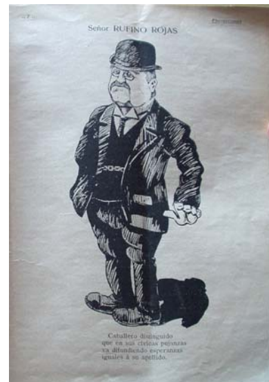
“Rufino Rojas”, Proyecciones , Bahía Blanca, año I, n° 11, 11 de septiembre de 1909, p. 7.

Por medio de imágenes como ésta Proyecciones contribuyó a construir una representación de los distintos sectores que, más allá de las diferencias particulares, poseían un capital político, económico y simbólico compartido. No puede llamar la atención entonces que Rufino Rojas, una de las figuras centrales de la política local, fuera caricaturizado con casi todos los atributos propios de su clase: desde la prominente papada hasta el reloj de cadena que asomaba por debajo del saco. A pesar de que la cuarteta debajo del dibujo evocaba su pasado como militante revolucionario de la Unión Cívica Radical (“Caballero distinguido/ que en sus cívicas pujanzas/va difundiendo