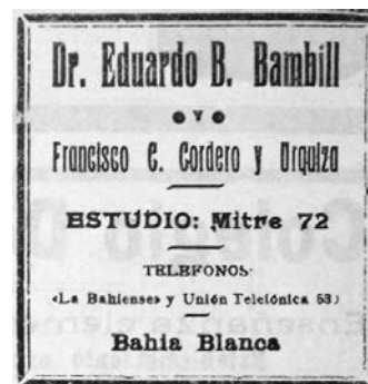
Aviso que aparecía periódicamente en el Bahía Blanca , durante 1909 y 1910.