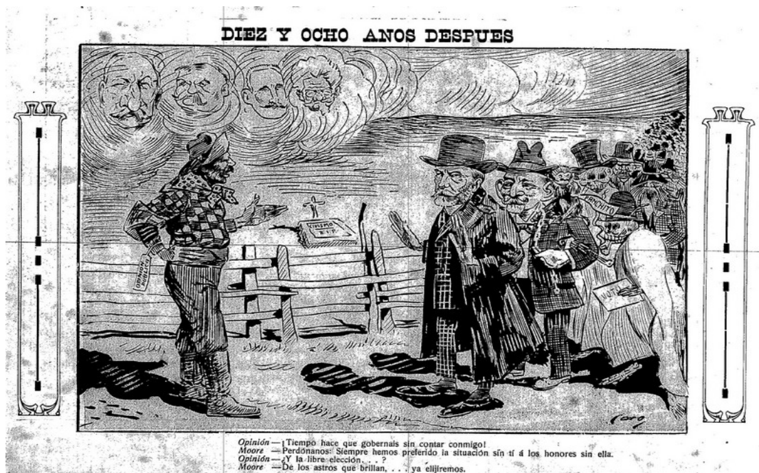
“Diez y ocho años después”, Hoja del Pueblo , Bahía Blanca, año IV, n° 213, 01 de septiembre de 1909.

La coincidencia entre los dibujos de Caro y las caricaturas de Proyecciones justifica la atención que prestamos a “Diez y ocho años después” en el párrafo anterior. Tópicos como la “muerte del civismo”, la crítica a la aproximación de los radicales al conservadorismo, 15 el oportunismo, la ineptitud y la corrupción de los funcionarios se encuentran presentes en el imaginario de la época y, por lo tanto, en las manifestaciones humorísticas de sus dibujantes y periodistas. Burlarse de las