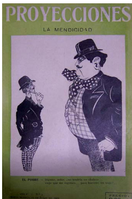
“La Mendicidad”, Proyecciones , Bahía Blanca, año 1, n° 3, 17 de julio de 1909, portada.