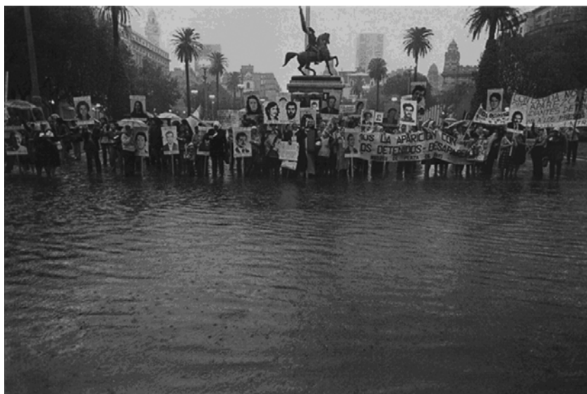
[Año 1983.].

En sus comienzos, se trató en general de la utilización de fotocarnet extraídas de los documentos de identidad de los desaparecidos. Fotos que eran utilizadas por los familiares, por las madres que buscaban a sus hijos, inicialmente con el objetivo bien concreto de individualizar a la persona que se buscaba en comisarías, hospitales, dependencias gubernamentales y eclesiásticas, entre militantes, con la esperanza de que ante su escamoteo de los registros burocráticos del Estado, alguien pudiera dar algún indicio de su paradero a partir de la ostensión de esa marca material de la identidad que es la fotografía del rostro. Una suerte de huella digital, pero decodificable por cualquiera. Huella digital hecha de gesto y de luz.