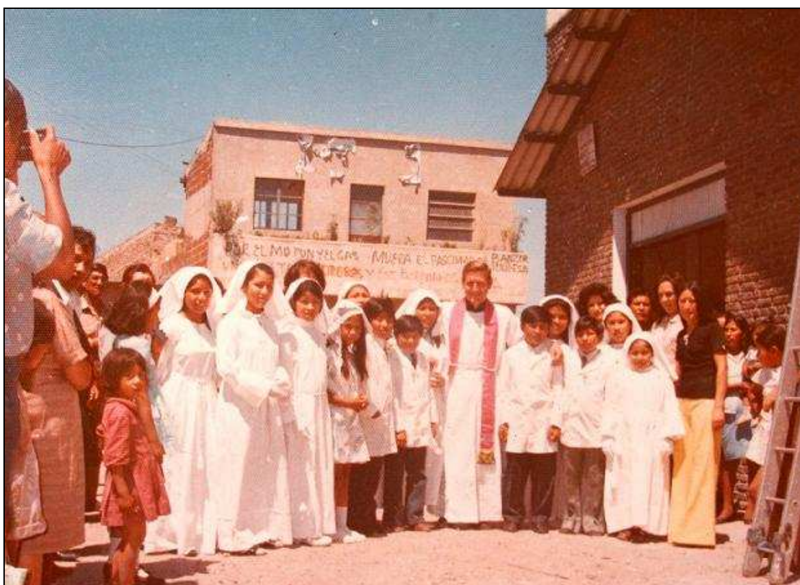
Carlos Mugica en una celebración religiosa en la Villa 31 de Retiro (ciudad de Buenos Aires) a comienzos de los años '70.

Hacia 1965, el padre Carlos Mugica inició su actuación pastoral en la Villa del Retiro al fundar la capilla de Cristo Obrero, ejemplo que fue imitado por otro grupo de sacerdotes en otras villas de la ciudad y que 1969 quedó legitimada por la autorización del Arzobispo Coadjutor Juan Carlos Aramburu para desarrollar una pastoral especialmente orientada al trabajo en las villas.