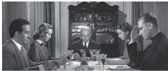
(1) Fotograma de Balarrasa (José Antonio Nieves Conde, 1950).

Tan sólo cinco de los documentos filmicos analizados sitúan la problemática del mercado negro en su propio contexto histórico y pertenecen por ello a la tipología de films de “reconstrucción histórica” establecida por Marc Ferro en su reflexión sobre la relación del cine con el tiempo, puesto que en ellos coinciden y se fusionan la época evocada y representada con el momento de filmación 21 . Tres de ellas son notables realizaciones cuyas tramas entran de lleno en el mundo del contrabando de posguerra y desprenden una cierta crítica y denuncia de las situaciones que relatan, aunque todavía muy tibias y difusas por los efectos silenciadores del aparato de censura. En Siempre vuelven de madrugada (Jerónimo Mihura, 1948) y Balarrasa (J.A. Nieves Conde, 1950) 22 (1), asistimos al retrato de ese turbio ambiente de jóvenes sin oficio conocido que viven del estraperlo y llevan una vida disoluta y sin futuro posible, con una visión negativa de las prácticas delictivas y una redención final de los personajes que nos hablan del posicionamiento claramente contrario y de denuncia de la corrupción del presente.