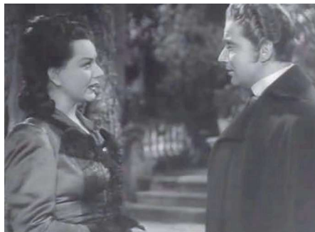
(4) Fotograma de La pródiga (Rafael Gil. 1946).

(4). En todas ellas asistimos a la interesada exposición de los conocidos mecanismos desarrollados por los sistemas políticos para acaparar, controlar y perpetuarse en el poder (intrigas, compra de votos y favores, pucherazos, favoritismo, tráfico de influencias...), mecanismos que conforman el concepto de corrupción política acuñado en el Franquismo, que se vincula e identifica con el liberalismo del siglo XIX y la podredumbre del sistema de partidos, que el nuevo régimen instaurado venía a regenerar para la salvación del país.