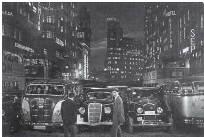
(2) Fotograma de El último caballo (Edgar Neville, 1950).

Por su parte, en la mirada pesimista de El último caballo (Edgar Neville, 1950), el estraperlo de penicilina aparece como uno más de los nocivos componentes del proceso de transformación deshumanizadora que conlleva la modernización de las ciudades contemporáneas 23 (2).