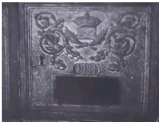
(3) Fotograma de Apartado de correos 1001 (Julio Salvador, 1950).

Más reducido, aunque no menos relevante es el apartado de películas que narran el tema de la corrupción política en sus diversas formas, prácticas y escenarios (conspiraciones, caciquismo, fraudes electorales...). Y de nuevo se nos muestra una corrupción que acontece de forma alejada en el espacio y en el tiempo: en la Castilla de mediados del siglo XV, durante el reinado de Juan II, como vemos en Doña María la Brava (Luis Marquina, 1948), el siglo XIX que sirve de marco cronológico a La pródiga (Rafael Gil, 1946) y Pequeñeces (Juan de Orduña, 1950) o en la lejana Centroamérica donde transcurre la acción de Póker de ases (Ramón Barreiro, 1947) 27